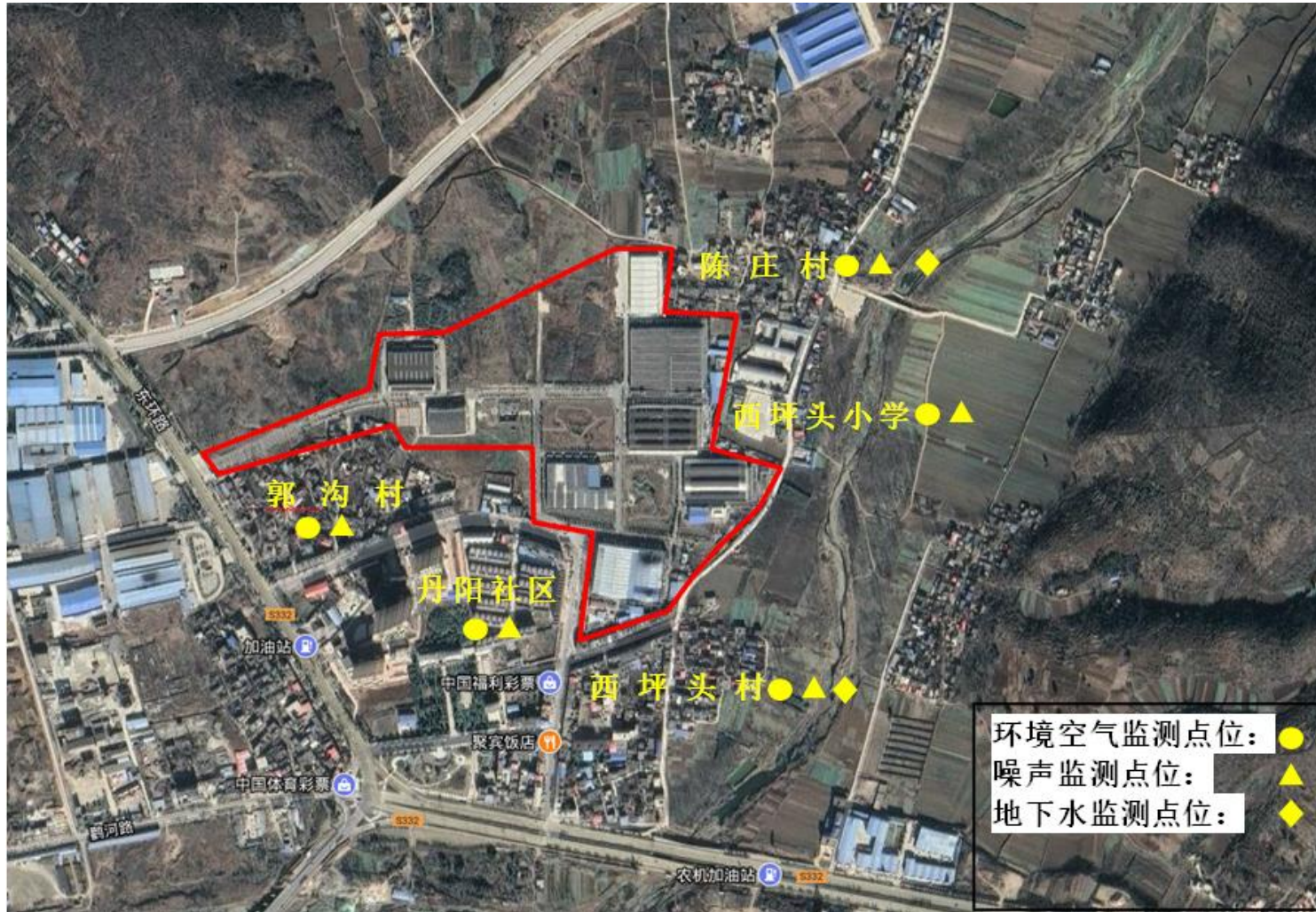
附图四 厂区周边敏感点监测点位图